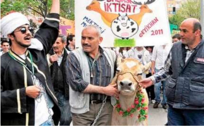
İMAM SESLENİYOR/"duasını" okuyor, İNEK ŞAŞKIN