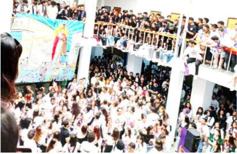
MERDİVENLİ SALONDA FERMAN OKUNUYOR: HAZIR MIYIZ?

Dileğimiz, 2024'te ve gelecek yıllarda barışçıl bir hava içinde ve daha canlı, daha zengin, İnek Bayram'larının gerçekleştirilmesi; bu tür şenliklerin Ankara Üniversitesi düzeyinde, hatta giderek Ankara'daki ve Türkiye'deki üniversitelerarası düzeyde örgütlenmesi; böylece, yükseköğrenim gençliği arasında ülke boyutunda tanışma ve kaynaşmanın sağlanması, toplumsal barışa katkıda bulunulmasıdır.