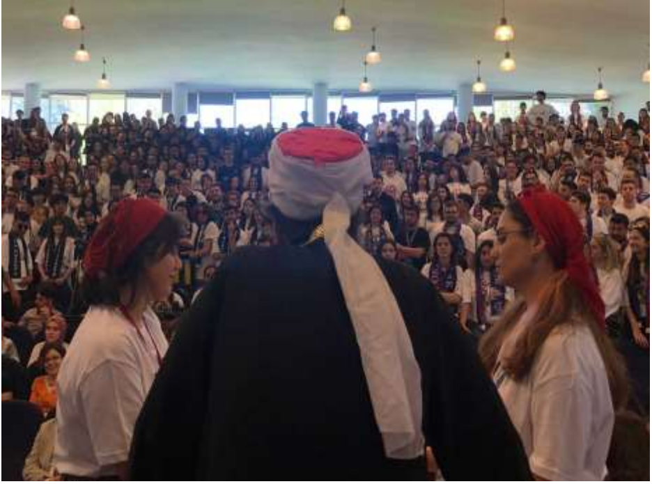
BÜYÜK ANFİDE BİR AKADEMİK ŞOVDAN bir anı

"Oyuncularımız" maalesef tiyatro dalında kariyer yapamadılar. Ama ülkeye ve yurttaşlarına hizmette kusur etmediler. Hakları yenilmesin. Laf aramızda.