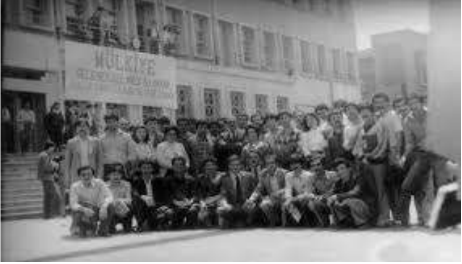
1982'de “MÜLKİYE GELENEKSEL İNEK BAYRAMI. KÜLTÜR, SANAT, GÜLDÜRÜ VE SPOR ŞENLİĞİ” bandroluyla ŞENLİK DÜZENLEYİCİLERİNDEN BİR BÖLÜM SBF girişi önünde