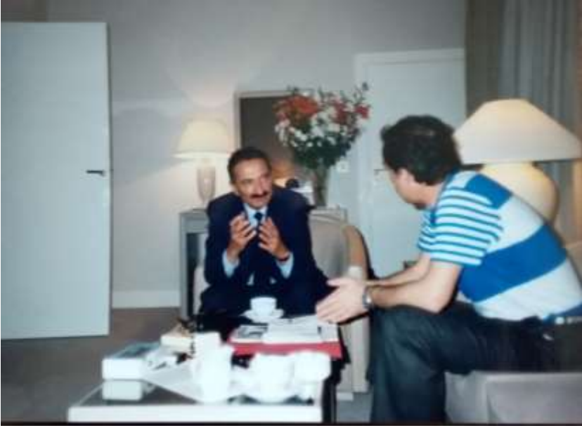
BÜLENT ECEVİT'LE. PARİS, 10 MAYIS 1989.

bulunmasının ve onun tek yönlü ve gereğinden fazla grev karşıtlığı CHP için gerçek bir şanssızlık olmuştur. Sirer'in değiştirilmesi konusunda beliren eğilimin bilemediğimiz nedenlerle bir sonuca ulaştırılamaması ve İsmet İnönü'nün de greve karşı tavır takınması CHP'nin işçi oylarını yitirmesinde başlıca rollerden birini oynamıştır.